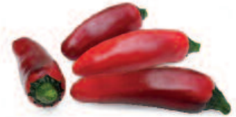
Fundador, F 1