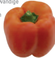
Torero, F 1