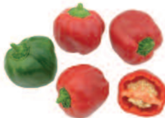
Kobold, F 1