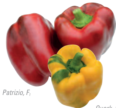
Patrizio, F 1