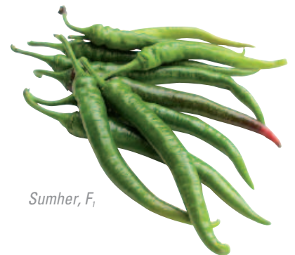
Sumher, F 1