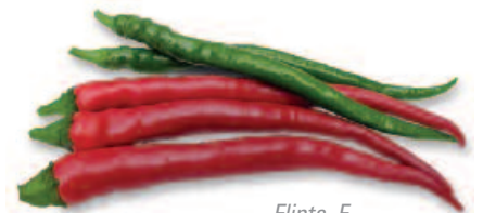
Flinta, F 1