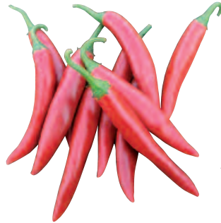
Amando, F 1