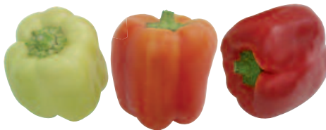
Ice Age, F 1