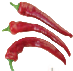
Hyper, F 1