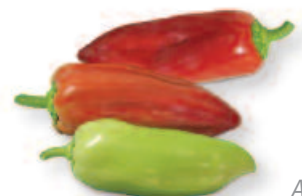
Agio, F 1