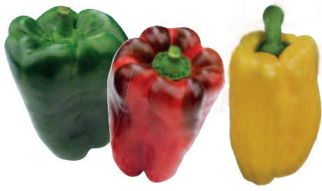
Aurelio, F 1