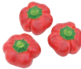
Peppino, F 1